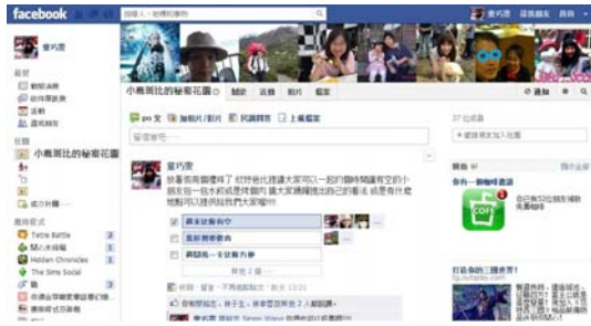
圖 1 FB 秘密社團--小鹿斑比的秘密花園