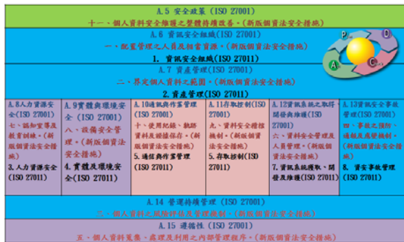
圖1整合ISO 27001 & ISO 27011與新版個資法安全措施導入P-D-C-A

範。透過內部稽核、外部稽核協助企業找到弱點並有效改善，最終得到 ISO 認證，如圖 1 將 ISO 27001 & ISO 27011 整合與新版個資法安全措施導入 P-D-C-A[5]。